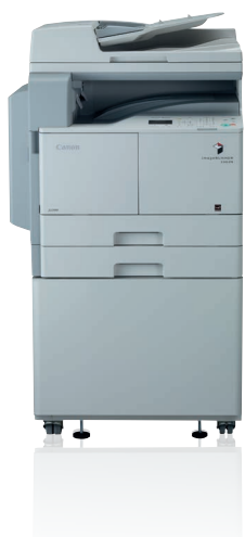
imageRUNNER 2202N z opcjonalnym automatycznym podajnikiem dokumentów, kasetą i podstawą