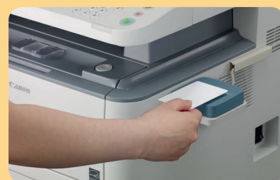
Opcjonalne uwierzytelnianie przy użyciu karty uniFLOW

uniFLOW MyPrintAnywhere 1 — dokumenty można odbierać z dowolnego, najdogodniej umiejscowionego urządzenia w sieci, niezależnie od tego, dokąd zostały wysłane.